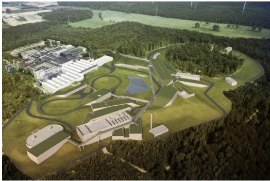
Abbildung 3 Fotomontage der FAIR Anlage