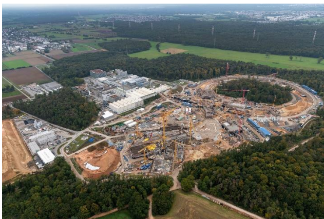
Abbildung 1 Luftaufnahme der Baustelle der FAIR