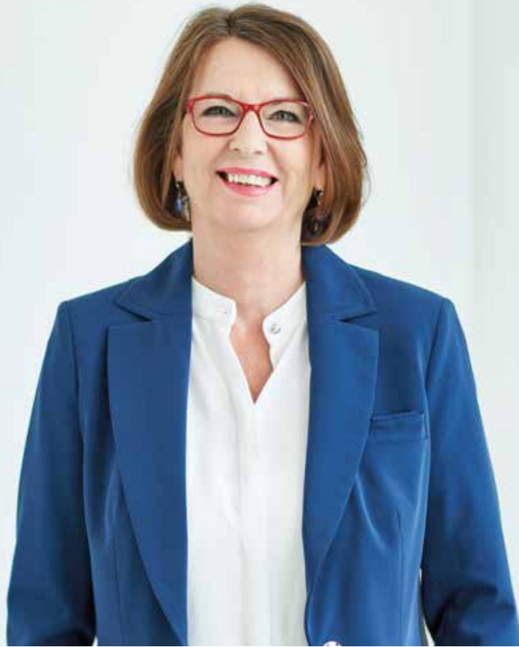
Priska Hinz, Hessische Ministerin für Umwelt, Klimaschutz, Landwirtschaft und Verbraucherschutz

„Die Hälfte der hessischen Bevölkerung lebt schon heute auf dem Land - und das gerne. Damit dies so bleibt und noch mehr jüngere Menschen und Familien dort eine Zukunft sehen, wollen wir die Lebensbedingungen weiter verbessern. Der Aktionsplan „Starkes Land - gutes Leben“ beschreibt konkret, was wir tun wollen, um ländliche Räume zu stärken und weiterzuentwickeln.“